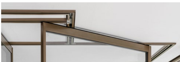
Bahnhof integriert in Decke