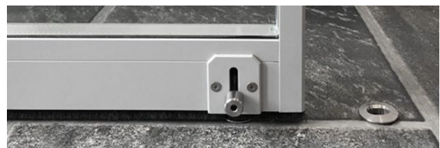
Steckriegel mit Bodenhülse