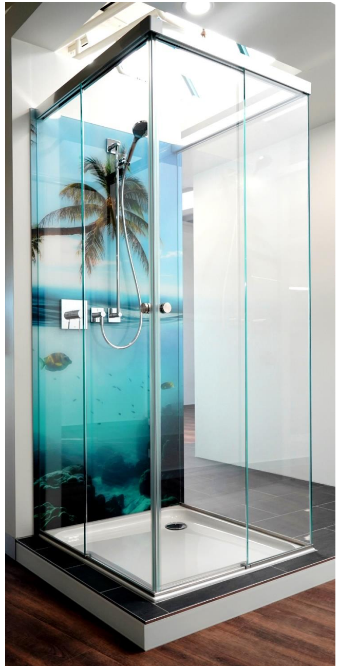
Individuelle Glasrückwand mit hochauflösendem Photoprint

Mit einem hochauflösenden Photoprint ist eine noch individuellere Gestaltung und jeder noch so spezifische Kundenwunsch realisierbar.