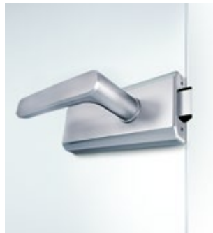
Studio Gala 2.0