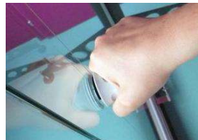
2. nach rechts drehen