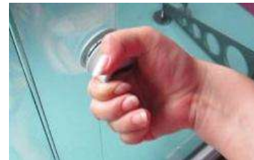
5. Knopf langsam loslassen