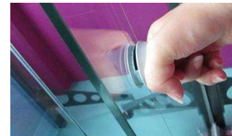
3. Flügel ziehen