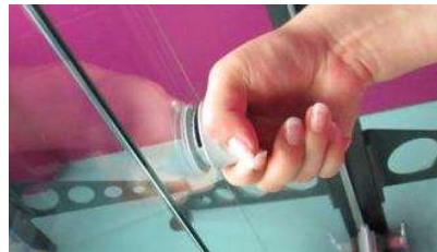
4. Verriegelung öffnen (Knopf nach rechts drehen) Flügel zustossen